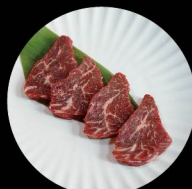
C3. 樂天澳洲和牛封門柳 Australian Hanging Tender Level 1: 3片 pcs Level 2: 3片 pcs Level 3: 4片 pcs