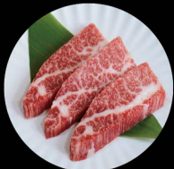
A1. 上等牛肋肉 Top Kalbi Level 1: 2片 pcs Level 2: 2片 pcs Level 3: 3片 pcs