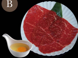
B1. Yaki-Shabu 上等牛赤肉 Top Lean Yaki Shabu Level 1: 2片 pcs Level 2: 2片 pcs Level 3: 3片 pcs