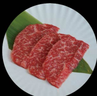
B3. 牛赤肉 Lean Level 1: 2片 pcs Level 2: 2片 pcs Level 3: 3片 pcs