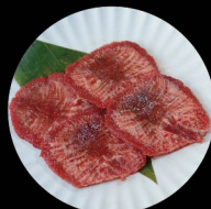
C2. 上等牛舌 TOP Ox Tongue (US) Level 1: 3片 pcs Level 2: 3片 pcs Level 3: 4片 pcs