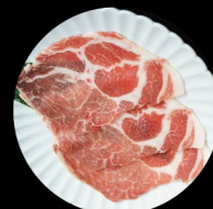
D3. 霧島黑豚梅肉薄燒 Kirishima Kurobuta Collar Level 1: 2片 pcs Level 2: 2片 pcs Level 3: 3片 pcs

所有燒肉午餐包括 all Yakiniku lunch served with: