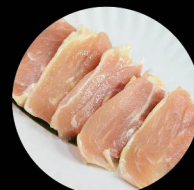
D2. 雞腿肉 Chicken Thigh Level 1: 3片 pcs Level 2: 3片 pcs Level 3: 5片 pcs