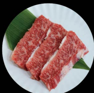
B2. 牛肋肉 Kalbi Level 1: 2片 pcs Level 2: 2片 pcs Level 3: 3片 pcs