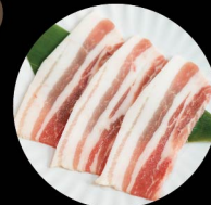
D1. 霧島黑豚豚肉 Kirishima Kurobuta Belly Level 1: 2片 pcs Level 2: 2片 pcs Level 3: 3片 pcs