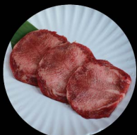
A3. 極上牛舌 Finest Ox Tongue Level 1: 2片 pcs Level 2: 2片 pcs Level 3: 3片 pcs