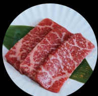
A2. 上等牛赤肉 Top Lean Level 1: 2片 pcs Level 2: 2片 pcs Level 3: 3片 pcs